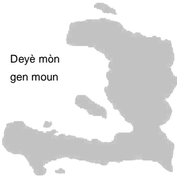
Plate-Forme Haïti de Suisse