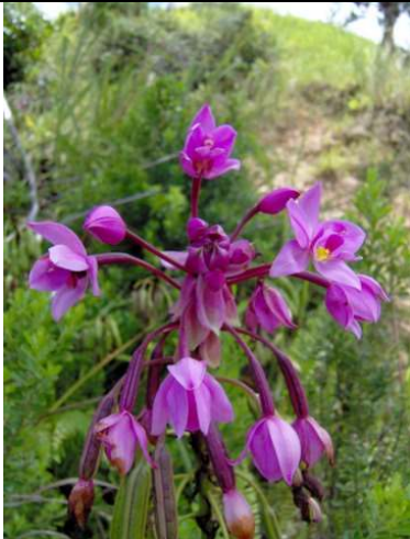
Exubérance de la nature

À vous toutes et tous qui portez Haïti dans votre cœur !